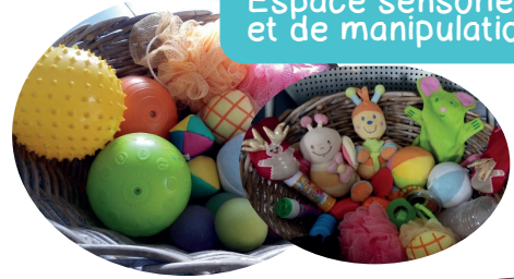
Espace sensoriel et de manipulation