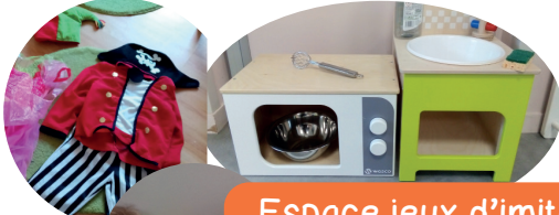
Espace jeux d'imitation/ jeux de rôle