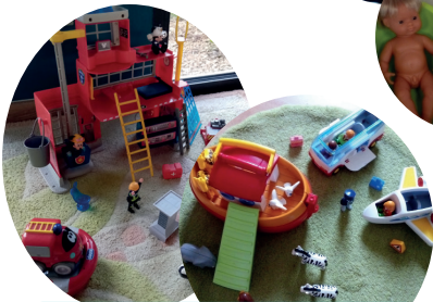
Espace mise en scène