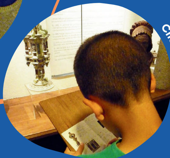
Cherche et trouve